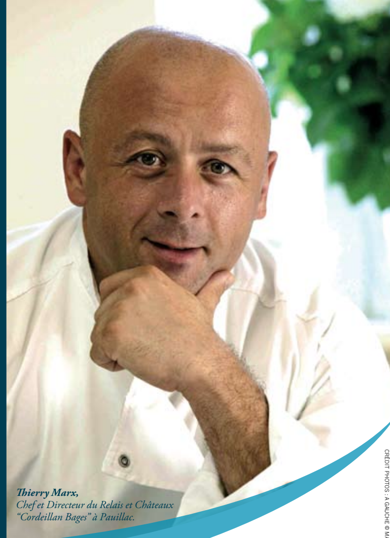
Thierry Marx, Chef et Directeur du Relais et Châteaux “Cordeillan Bages” à Pauillac.