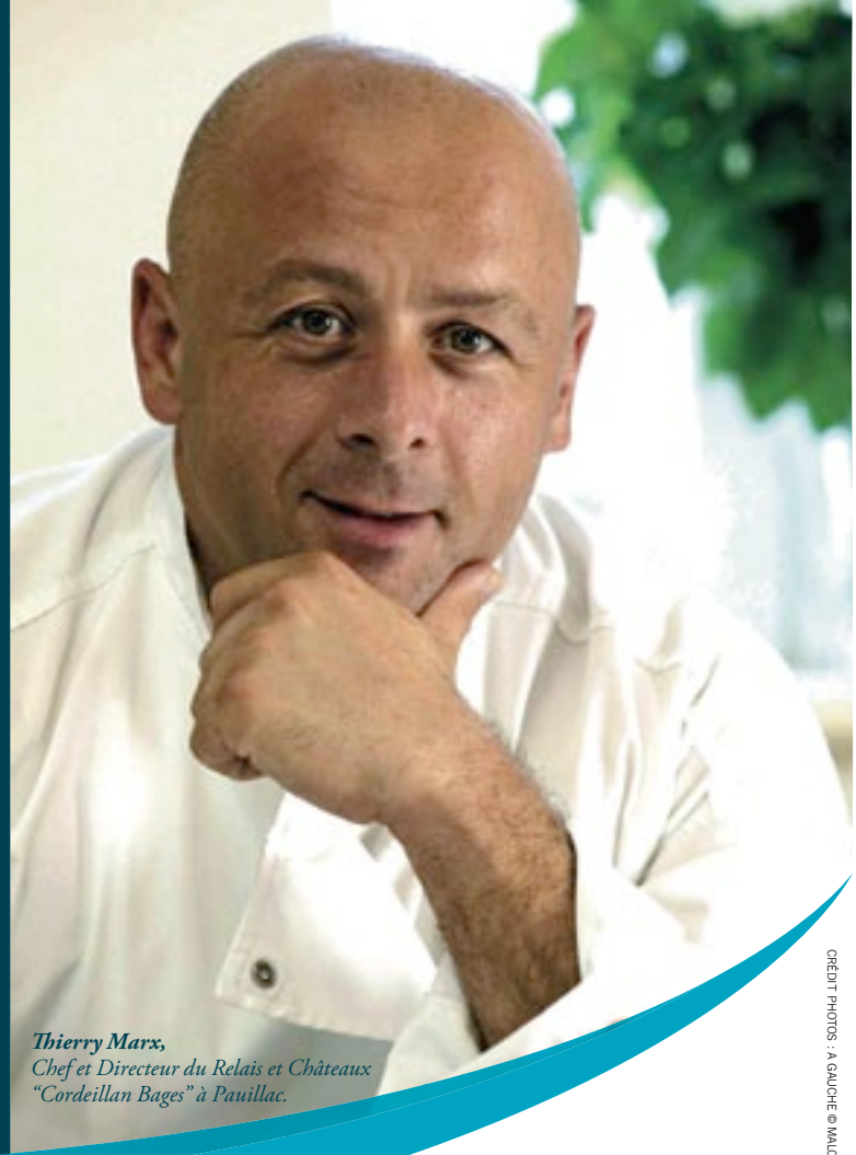
Thierry Marx , Chef et Directeur du Relais et Châteaux “Cordeillan Bages” à Pauillac.